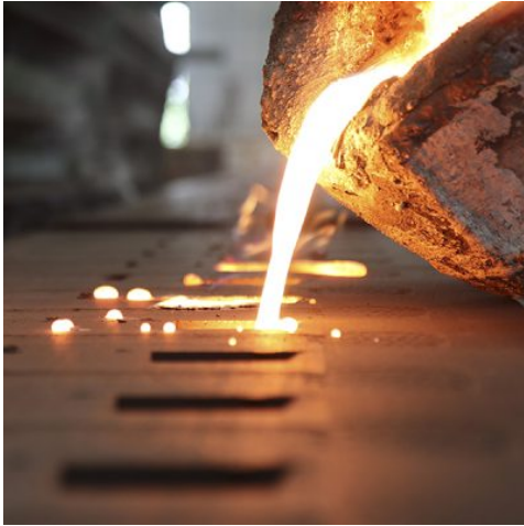
MASTER GHISA: PROPRIETÀ APPLICAZIONI FABBRICAZIONE