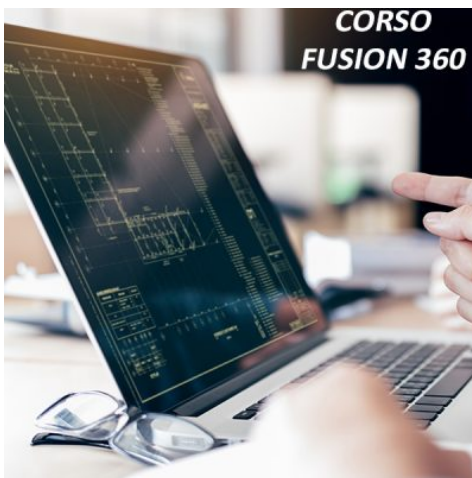
CORSO FUSION 360