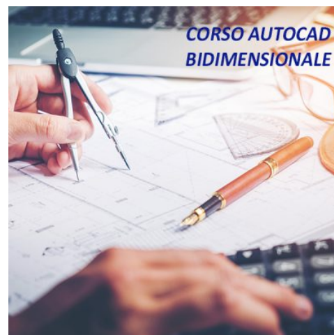
CORSO AUTOCAD BIDIMENSIONALE