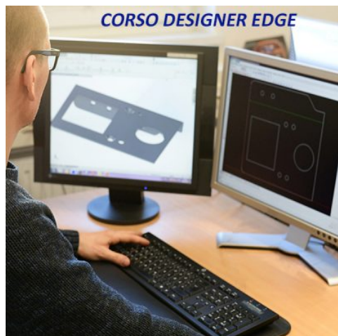
CORSO DESIGNER EDGE