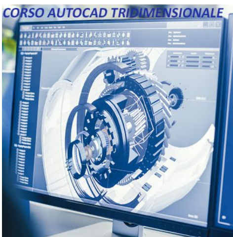
CORSO AUTOCAD TRIDIMENSIONALE