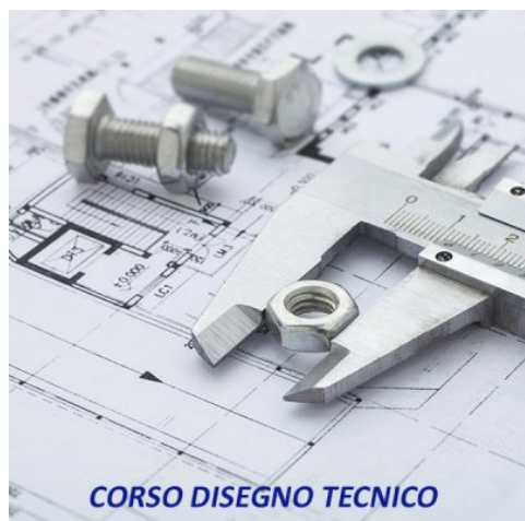
CORSO DISEGNO TECNICO